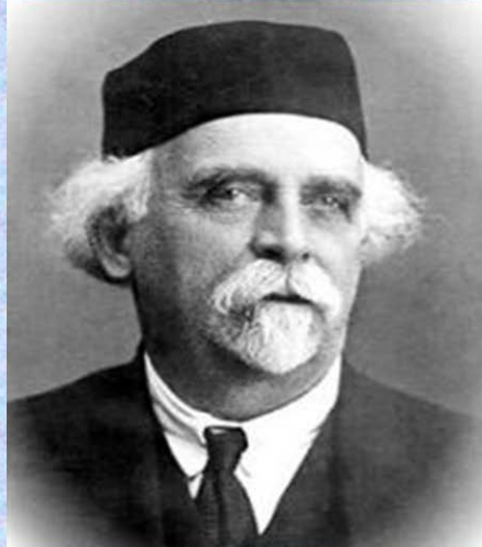
Николай Дмитриевич Зелинский (1861-1953 г.г.)

В качестве поглощающего элемента использовался древесный уголь. Первые испытания противогаза в боевых условиях прошли в августе 1915 года и подтвердили его высокую надежность.