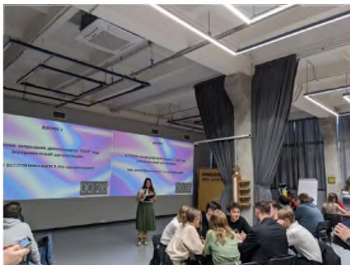
Рисунок 2 – Фрагмент квиза

Формат «Спортивный турнир». Антитеррористическая компонента может быть встроена и в спортивные мероприятия. Пример – организация турнира в память о герое антитеррористической операции по тому виду спорта, который в юности мог увлекаться данным герой.